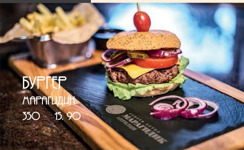
БУРГЕР МАРАГИДИК 350 15.90