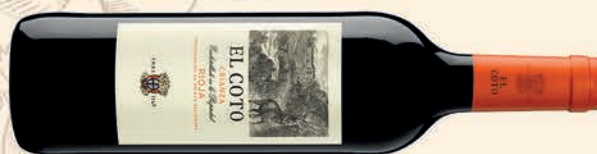
ЕЛ КОТО КРИАНЦА, РИОХА, ИСПАНИЯ 750 39.00