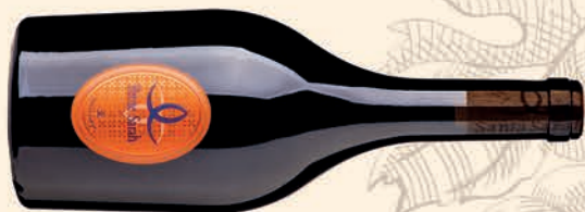
ПЕТИТ САРА РЕД, ВИНАРСКО ИМЕНЦЕ САНТА САРА 750 49.00