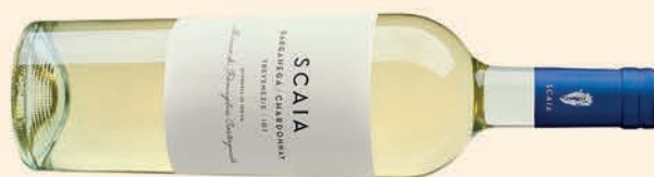
СКАЈА ГАРГАНЕГА & ШАРДОНЕ ТРЕВЕНЦИЕ ИGT 750 41.00