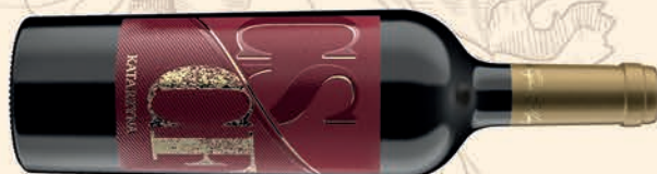
КАТАРЖИНА КАБЕРНЕ СОВИНЬОН & КАБЕРНЕ ФРАН, КАТАРЖИНА ЕСТЕИТ 750 41.00