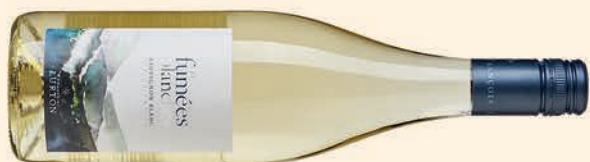
ЛЕ ФИУМЕ БЛАНШ СОВИЊОН БЛАН 750 39.00