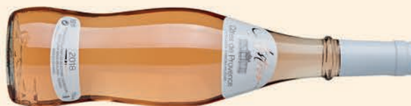
ШАТО Д 'АСТРОС 750 41.00