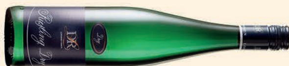
РИЗЛИНГ ДРАЈ 750 39.00