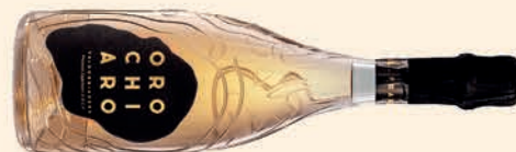
ПРОСЕКО ОРОКЦАРО ВАЛДОБИАДЕНЕ / 750 55.00