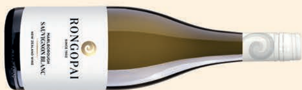
РОНГОПАЈ СОВИЊОН БЛАН 750 36.00