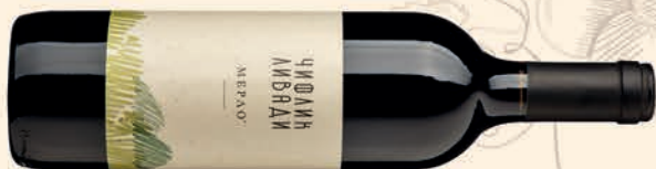
ЧИТЛИК ЛИВАДИ МЕРЛО ОРГАНИК 750 36.00