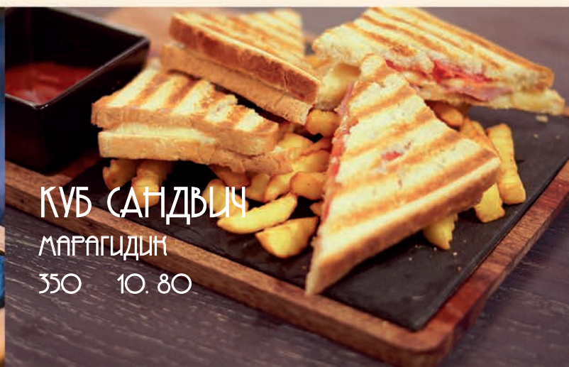
КУБ САНДВИЧ МАРАГИДИК 350 10.80