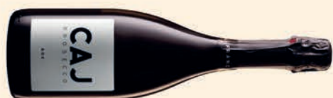
ПРОСЕКО КАЈ 750 48.00