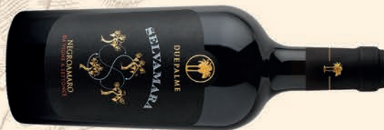
СЕЛВАМАРА НЕГРОМАРО САЛЕНТО IGP, КАНТИНЕ ДУЕ ПАЛМЕ, ПУЛИЯ, ИТАЛИЯ 750 36.00